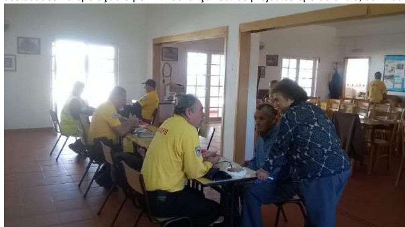
XLIV ACONCHEGO – 06, 07 e 08 ABR 18

Esta operação que se tem desenvolvido acentuadamente no território da Junta de Freguesia de Grândola e de Santa Margarida da Serra e com o apoio permanente e efectivo da sua Presidente, vem recebendo acrescida intervenção da autarquia de Grândola que, vem recuperando e melhorando as instalações da BoOGra em Água Derramada, essenciais para imprescindível no apoio logístico aos operacionais da ANAFS destacados na operação e permitindo lançar outros projectos operacionais, contribuindo assim para os objetivos humanitários da Associação.